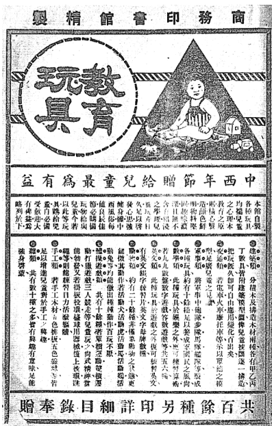
圖三：「教育玩具」。

注視之中，被凝視的兒童承載了社會想像，變成了「一間貯藏了渴望——即盼望中國從半殖民地狀態超越而出的渴望——的替代品的儲物室。」 54