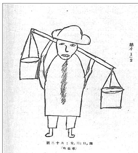
圖二：出自一位十一歲女孩之手。見黃翼原書第29頁原圖26。鳴謝華盛頓大學（西雅圖）東亞圖書館。