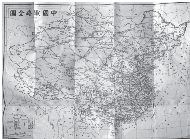
圖一：〈中國鐵路全圖〉 59

號、圖例，本文也主要從這兩個面向著手分析此圖。同時，由於我們把地圖視作一個知識生產的裝置，比起視覺圖像來說，其接近於理論。地圖在引入闡釋、掌控現實的敘述話語和表徵模型的同時，往往又把自身作為其闡釋現實的例證，所以「只有通過生產其他地圖或理論才能使其受到挑戰」。 58 故本文亦會注重相關地圖之間的比較研究。