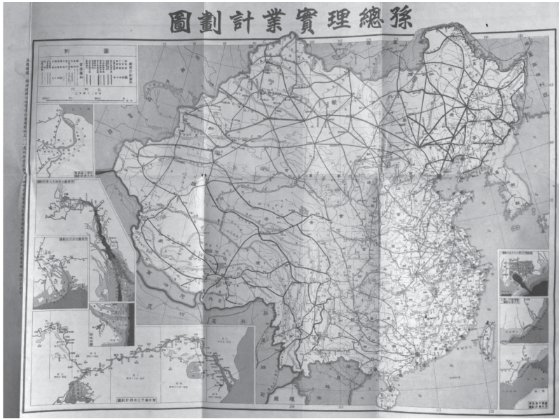
圖四：〈孫總理實業計劃圖〉 69

道整治的8幅附圖。最左一列紅字註明：「本圖謹遵總理建國方略實業計劃繪製。地名一一遵照原書，毫無苟且減略之處。茲為便利學者讀建國方略起見，隨圖附贈一幅，不另取資。」圖的背面印有戴傳賢節錄的《建國方略題表》，主要分為「開發交通」、「建造港埠」、「興辦食衣住行工業」、「創設各種大工廠」等欄目，簡單清楚，易於查找或記憶。此本圖集的主要編繪者洪懋熙（1898-1966），字勉哉，江蘇丹陽人，民國時期著名的地圖從業者。其自幼隨童世亨在上海開辦的中外輿圖局學習編繪地圖，後成為上海商務印書館的繪圖員，1922年應屠思聰之邀到上海世界輿地學社編制地圖，後於1924年創辦並主持東方輿地學社，繼續繪製、出版地圖。他在圖集前言就指出，這是中學程度適用的教科書，亦有普及大眾之效，故而特別提倡愛國思