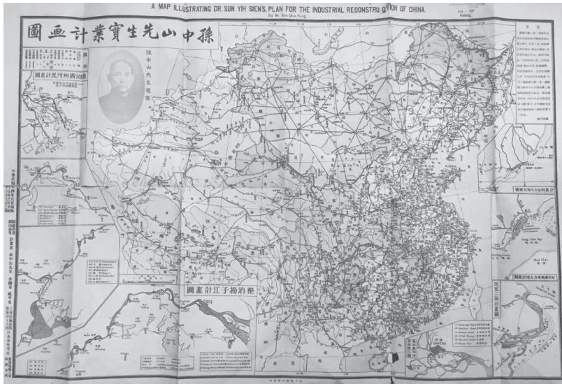
圖五：〈孫中山先生實業計劃圖〉 71

不讀《建國方略》一書，讀《建國方略》者不可不備本圖」。這固然有廣告推銷之嫌，但也反映出對於國家的想像而言，製圖學的視覺呈現是對文字敘述的鞏固與規範。蘇甲榮，字演存，廣西藤縣人，典型的五四一代知識分子。其早年考入北京大學文科哲學門，與同班的徐彥之（1897-1940）、朱自清（1898-1948）等人加入王光祈（1890-1936）發起的少年中國學會，並出任《少年中國月刊》編輯。蘇甲榮於1922年在北平創立日新輿地學社，北伐期間，還一度出任第八軍秘書、第十五路軍秘書長。在日本侵華戰爭時期，蘇甲榮同樣是以繪製地圖的方式來進行自己的抗日鬥爭：〈各國在華交通侵略圖〉、〈日本侵略我東北地圖〉、〈日本侵略灤河圖〉、〈上海戰區地圖〉等一系列地圖或是向同胞警示日軍的侵略動向，或是說明日軍的侵略罪行。蘇甲榮因此而受到日本憲兵的注意，最終被迫害致死。